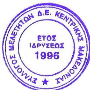
ΜΑΡΙΑ ΓΡΗΓΟΡΙΑΔΟΥ Πολιτικός Μηχανικός